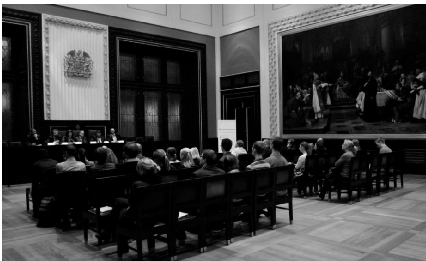
Panelová diskuse „Advokacie – byznys, nebo součást výkonu spravedlnosti?“ se konala v Praze v březnu 2014.

Na jaře jsme se tohoto tématu dotkli v Praze panelovou diskusí na téma „Advokacie – byznys, nebo součást výkonu spravedlnosti?“ a v Brně jsme upořádali první diskusní forum na téma profesní etiky. Toto forum se věnovalo obecně výuce profesní etiky na fakultách a v rámci profesní přípravy různých právnických profesí. Mezi účastníky jsme měli tu čest přivítat zástupce Ústavního soudu, správního soudnictví, akademické obce i advokacie. Nechyběla ani návazná diskuse se studenty. Ve spolupráci s brněnskou fakultou a dalšími partnery se ovšem budeme věnovat konkrétnějším otázkám v rámci nově dohodnutého pětiletého rámce. Na podzim jsme pak uzavřeli partnerství s advokátní kanceláří Kinstellar a získali i financování z Velvyslanectví USA, abychom na tématu profesní etiky mohli ještě šířeji pracovat hned v roce 2015. K tématu připravujeme například workshopy a vydání publikace.