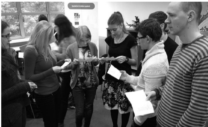
Lidská práva naživo, tedy odlehčená forma Školy lidských práv pro studenty nižších ročníků, se konala v Brně v říjnu 2014.

Zároveň se nám povedlo s brněnskou fakultou nastavit pravidla pro konání dalších podobných akcí za podpory tamního stipendijního systému. V příštích pěti letech tak budeme moci v Brně pořádat hned dvě akce ročně. Začali jsme také hledat nové partnery pro Školu lidských práv i na dalších právnických fakultách.